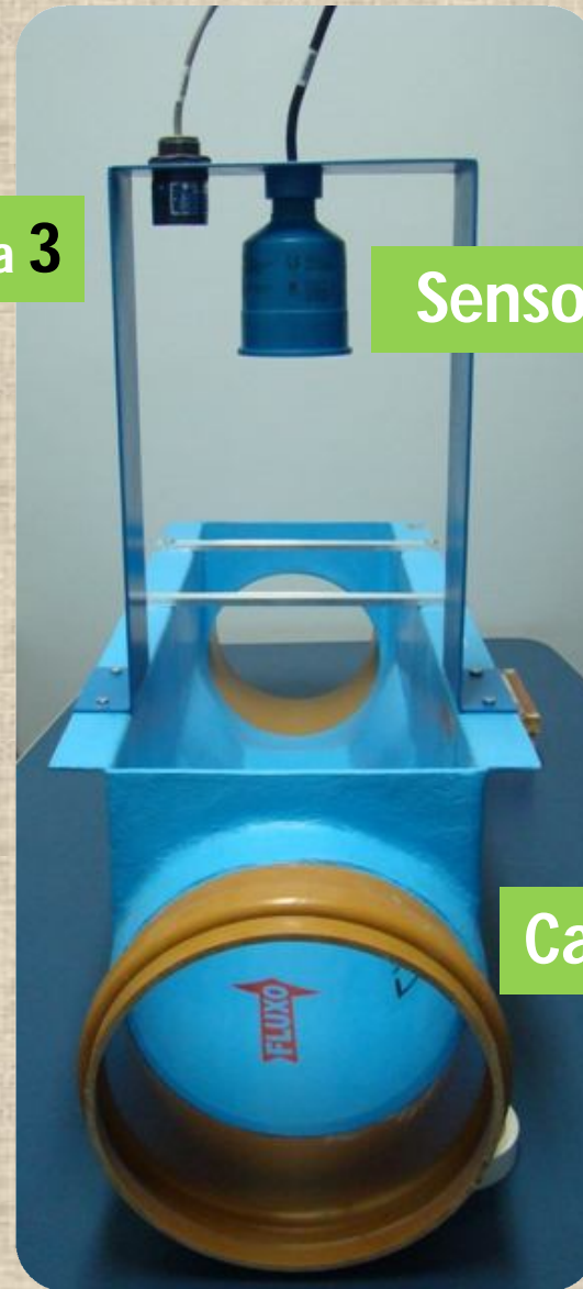
Calha Palmer 1